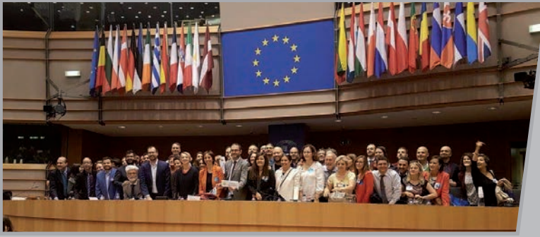
Espainako ordezkariak Europako Legebiltzarrean.