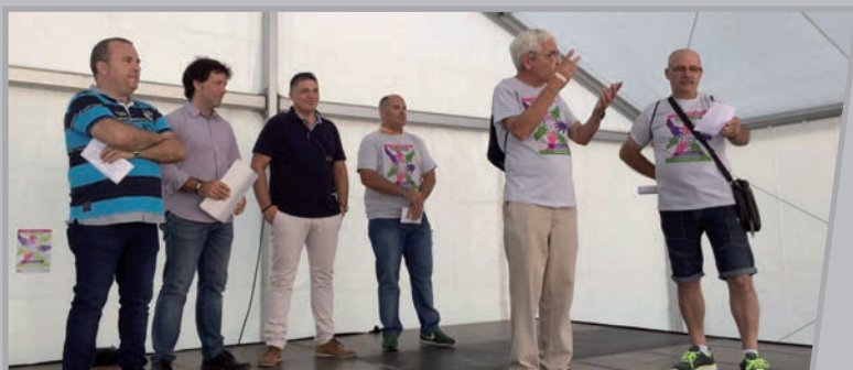
Adierazpen irakurketa eta Basauriko kaletatik manifestaldia.