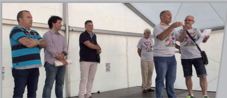
Adierazpen irakurketa eta Basauriko kaletatik manifestaldia.

Jardunaldia adierazpen irakurketarekin hasi genuen, gero herriko kaletatik joan ginen geure eskubideak aldarrikatzeko, eta gainera hainbat kultura eta aisialdi jarduerak egon ziren egunean zehar.