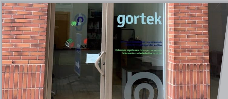
Gortek lokalaren aurrealdea.