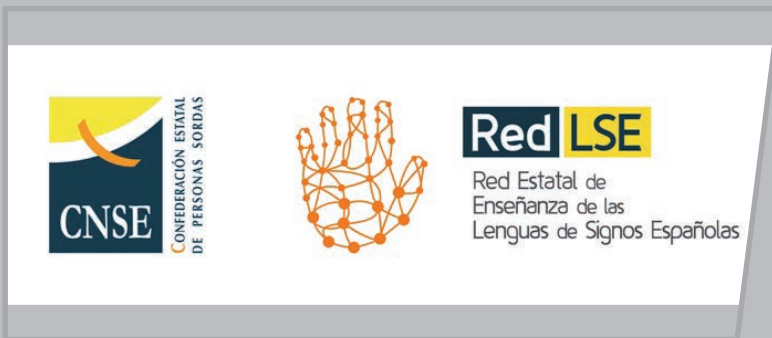
CNSEko EZH Sarearen logoa.