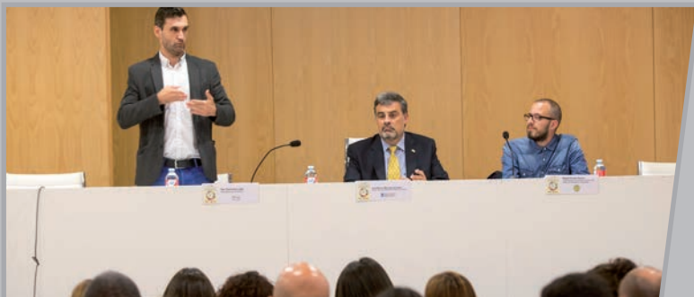
FAXPG-ko presidentearen mintzaldia.