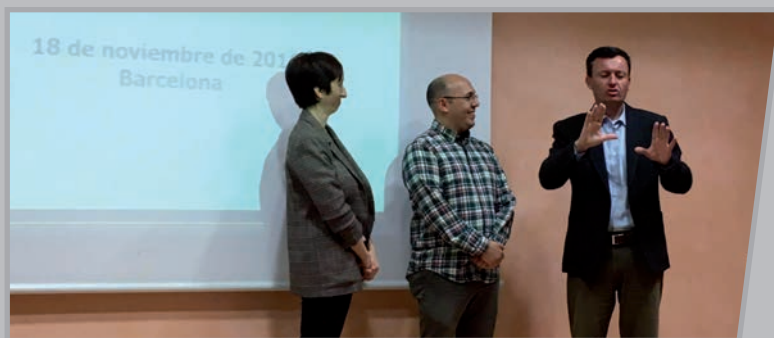
FESOCA-ko presidentek ongietoria egiten.