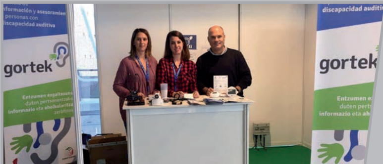
Gortek-en erakusketa Euskalduna Jauregian.