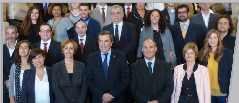
Argazkia Ahal-dun Nagusiarekin Foru Jauregiko eskaileretan.