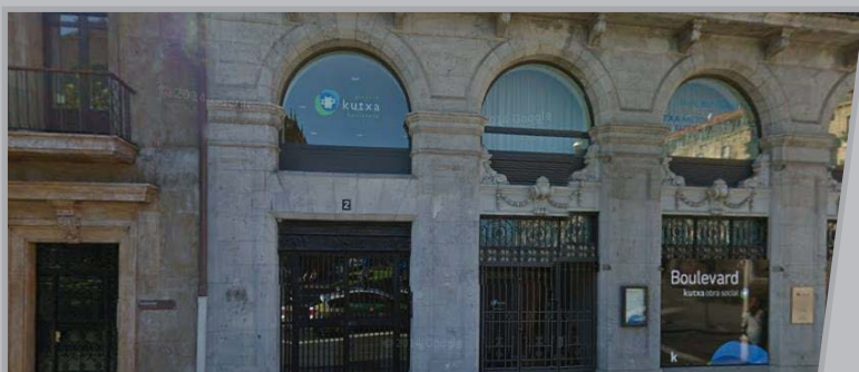
Okendo kaleko bulegoa.