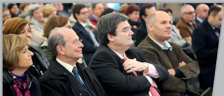
EGko presidentea Aburto sailburuaren ondoan jesarrita.