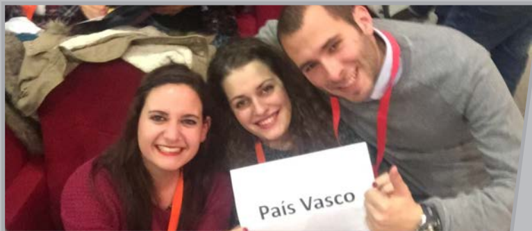
Euskal Gorrakeko Gazte Batzordearen kideak hautagaitzaren aurkezpenean.