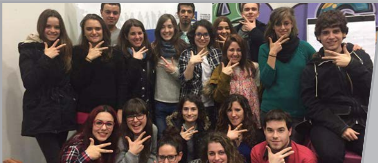
Foroan parte hartutako gazteak