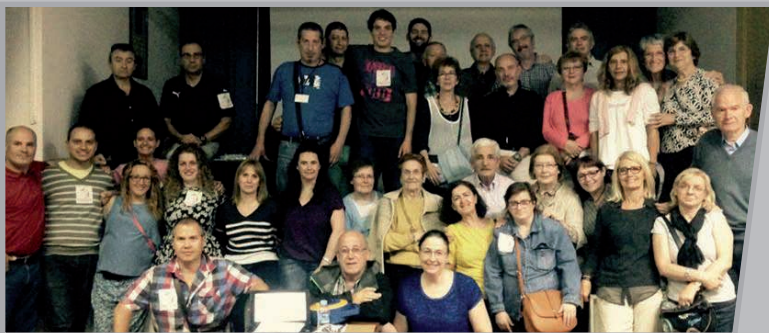
Batzarretan parte hartu zuten bazkideak.

Ekainaren 6an, larunbata, Bilbon izan zen Euskal Gorrakeko kide diren elkarteetako Presidenteen II Biltzarra.