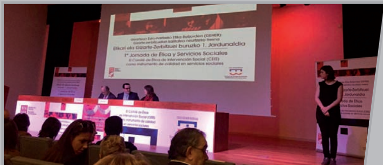
Jardunaldietako mahaiaren irudia .

2 Apirilaren 13an Euskal Gorrakeko presidenteak Bizkaiko Foru Aldundiak antolatutako Etika eta Gizarte Zerbitzuen I Jardunaldian parte hartu zuen.