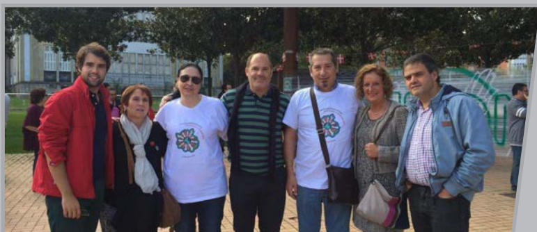
Foto con los representantes de las entidades de personas sordas y de la vida política: Partido Popular Vasco, Aspasor, Arabako Gorra, Euskal Gorra, PNV y Bildu.