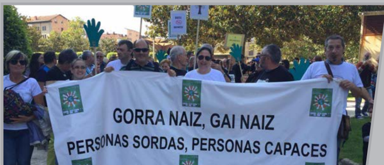
Vitoria-Gasteizeko kaleetan zehar egindako manifestazioaren burua.