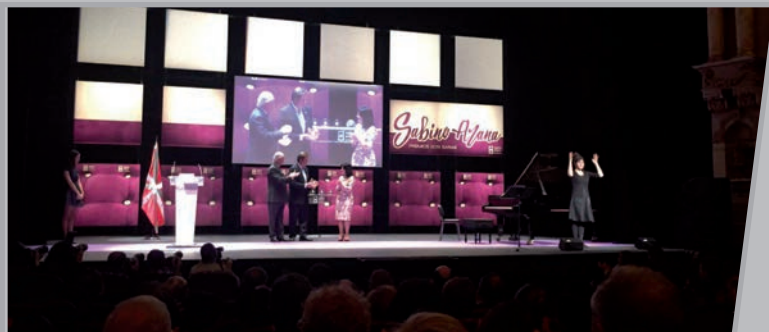
Arriaga Antzokian ospatutako ekitaldiaren panoramika.

Urtarrilaren 16ean, larunbata, Euskal Gorrakeko kide diren elkarteetako Presidenteentzako I Biltzarra izan zen. "Basauriko Gorrak" Basauriko Pertsona Gorren Elkartearen egoitzan.