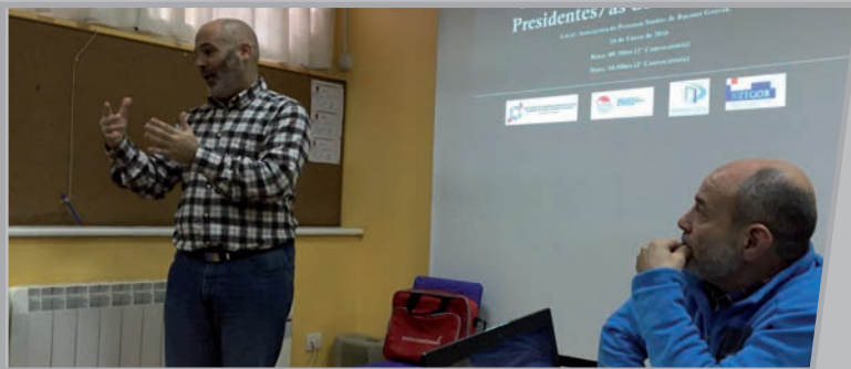
Euskal Gorrakeko Presidenteentzako biltzarrean parte hartzaileak bileran.