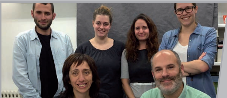
: CNSE eta EG-ko lantaldea.