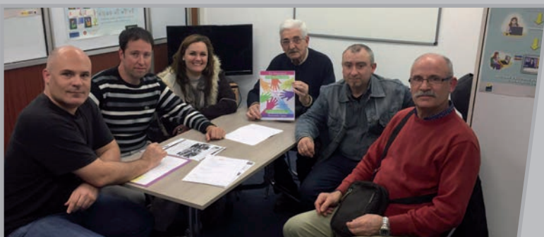
PGNE iragarkia erakusten den bileraren irudia.